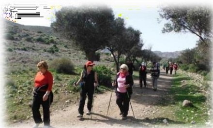
Promoción de la salud y ajuste físico