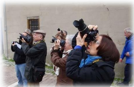
Manejo de nuevas tecnologías

El programa también pone en marcha una RED RURAL DE VOLUNTARIAS POR UN ENVEJECIMIENTO ACTIVO y buscará la colaboración de todas las entidades y actores que trabajan en el ámbito rural.